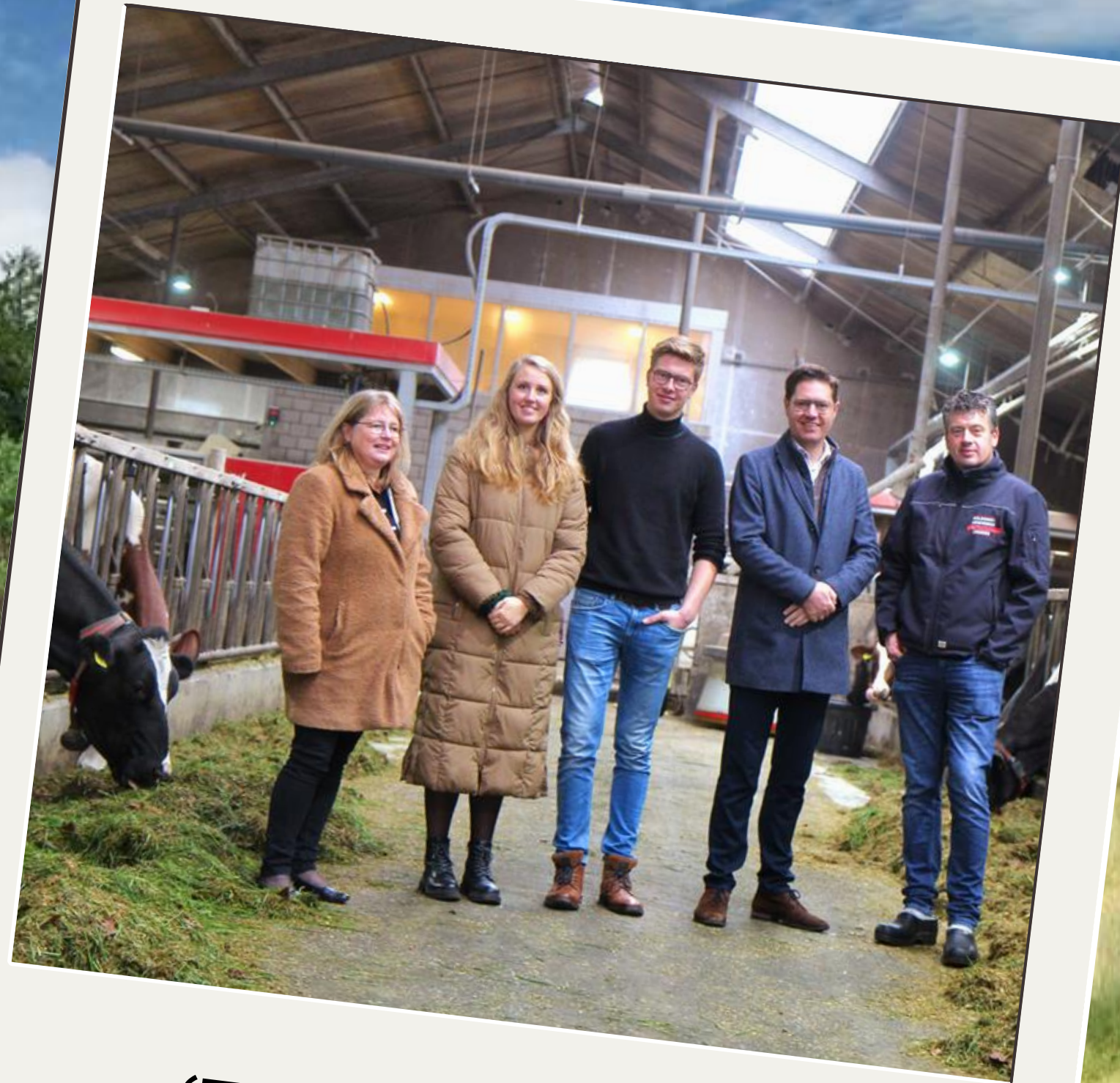
‘Tour de boer’