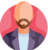
Vereniging Eemland 300 en Vereniging Vrij Polderland