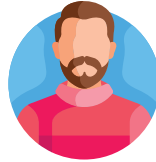
Stichting Nationaal Park Utrechtse Heuvelrug