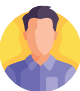
De Utrechtse natuurorganisaties Natuurmonumenten, Staatsbosbeheer, Utrechts Landschap, Natuur en Milieu Federatie Utrecht en Landschap + Erfgoed Utrecht