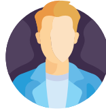
Ondernemers en vertegenwoordigers recreatieve sector