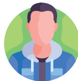
Het waterschap Vallei en Veluwe